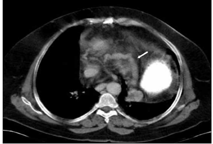
Resim 2. Abdomen BT'de genişlemiş inferior frenik ven ve perikardiakofrenik vene (ok) açılan subdiafragmatik transhepatik kollateraller vardır.