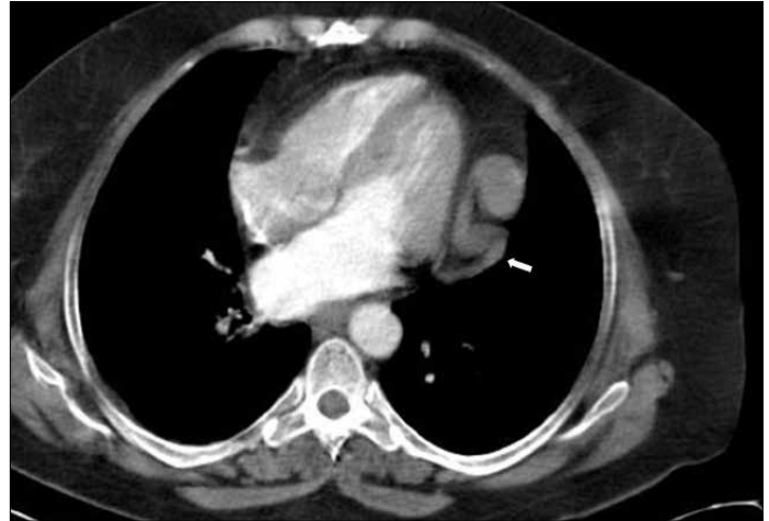
Resim 4. Toraks BT'de, sol parakardiyal alandaki nodül görünümüne, genişlemiş perikardiakofrenik varisler (ok) neden olmaktadır.

sol hepatik venin komşuluğunda sonlandığını bildirmiştir. İVK veya hepatik çıkış tıkanıklıklarında iki ven arasında kalıcı bağlantı oluşabilir [4]. Bizim olgumuzda da sistemik venöz dönüş inferior frenik vene transhepatik kollateraller yoluyla sağlanmaktaydı.